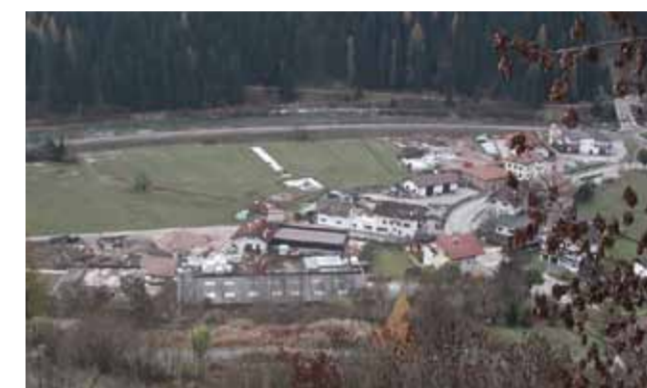
> Una delle aree industriali in fase di apprestamento